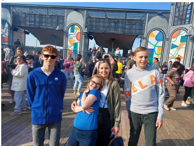
Zorggebruikers en begeleiding L3

We hebben er lekkere frietjes gegeten in de zon en daarna zijn we meteen terug gaan dansen! Super cool, zo een groot festival!