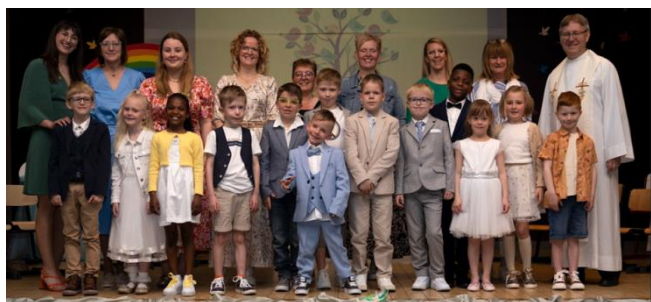
Het team van de eerste communicanten

Kortom het was een mooie, zonnige, unieke dag voor iedereen!