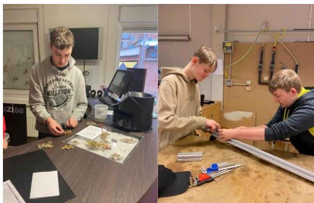
Tweedejaars – OV4

Enthousiaste leerkrachten (en derdejaarsleerlingen) begeleiden hen in de activiteiten. Verder stond er nog een infoavond voor de ouders op de planning.