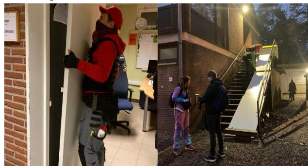
Zesde- en zevendejaars – OV4

De zesde- en zevendejaars vierden Chrysostomos. Ze waren al vroeg uit de veren om onze school te kunnen versieren. Vervolgens ontvingen ze onze leerlingen en leerkrachten zeer hartelijk. Daarna mochten ze de knietjes onder tafel schuiven voor een lekker ontbijt. Tot slot zijn we richting Kaatsheuvel vertrokken. In de Efteling hebben ze een heel leuke dag beleefd.