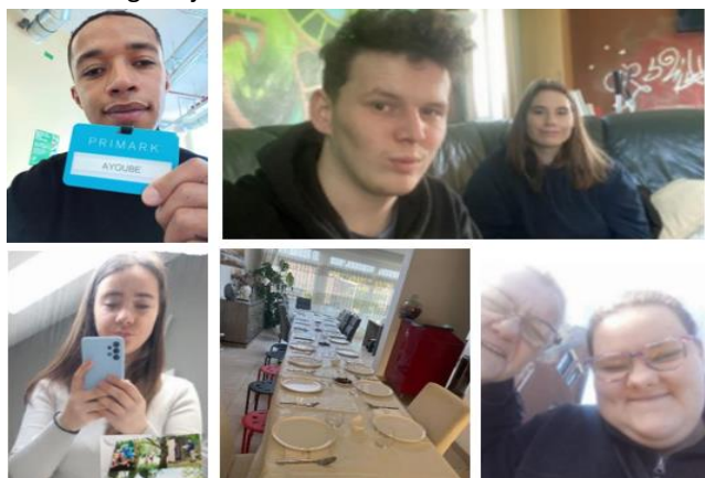
klas 7 OV2

Dit leverde een toffe collage op! Raad zelf maar welke foto er bij hoort. We wensen jullie allemaal een zomervakantie vol kleine gelukjes!