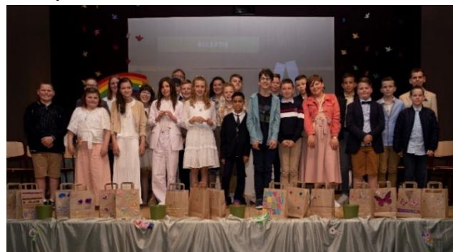
Het team van de plechtige communicanten